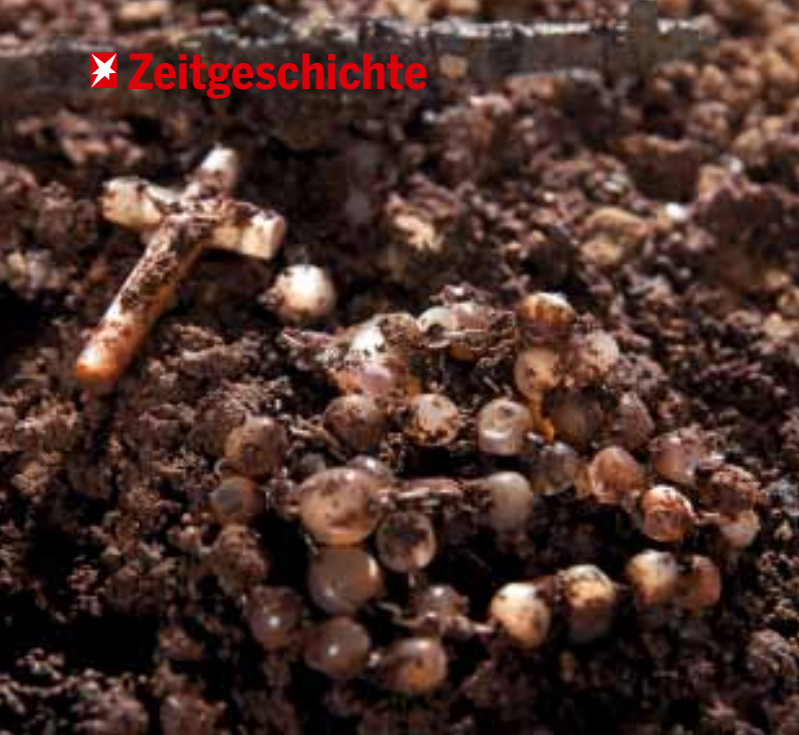
Ein Rosenkranz, der in einer der Höhlen gefunden wurde. Viele Flüchtlinge hatten Trost im täglichen Gebet gesucht. Die Forscher entdeckten auch Kochgeschirr, Schuhe, Medikamente

die Toiletten. Die Kinder machten hin, wo sie wollten. Der Gestank war widerlich.